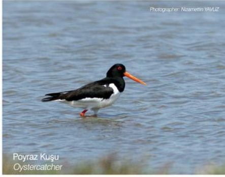
Poyraz Kuşu Oystercatcher