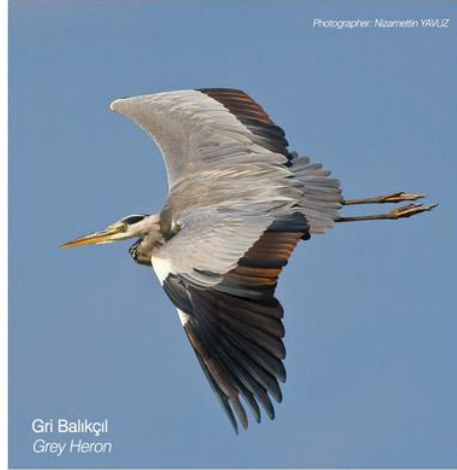
Gri Balıkcıl Grey Heron