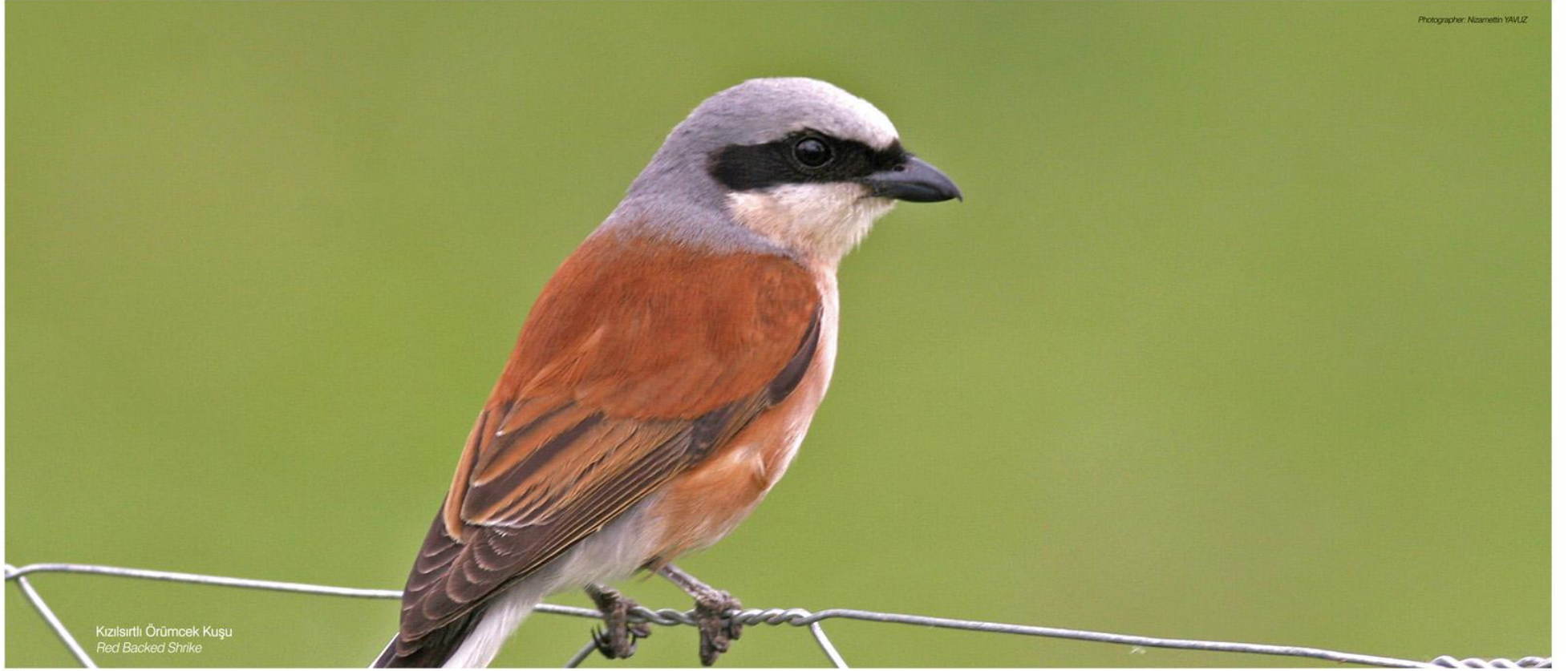
Kızılsırtlı Örümcek Kuşu Red Backed Shrike