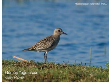
Gümüş Yağmurdan Grey Plover