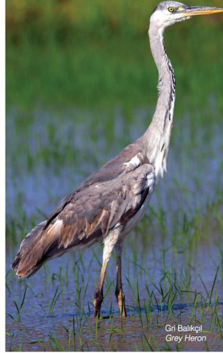
Gri Balıkçıl Grey Heron