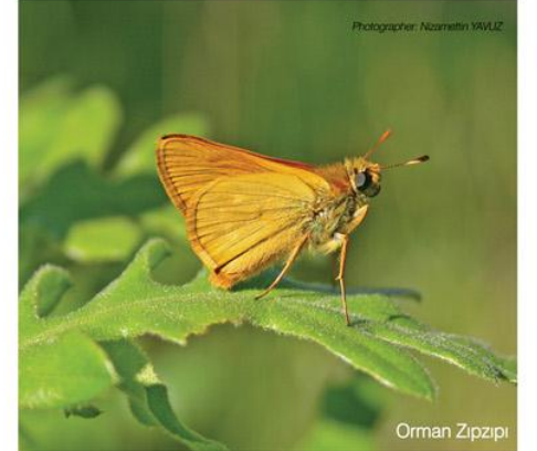
Küçük Zıpzıp Perisi