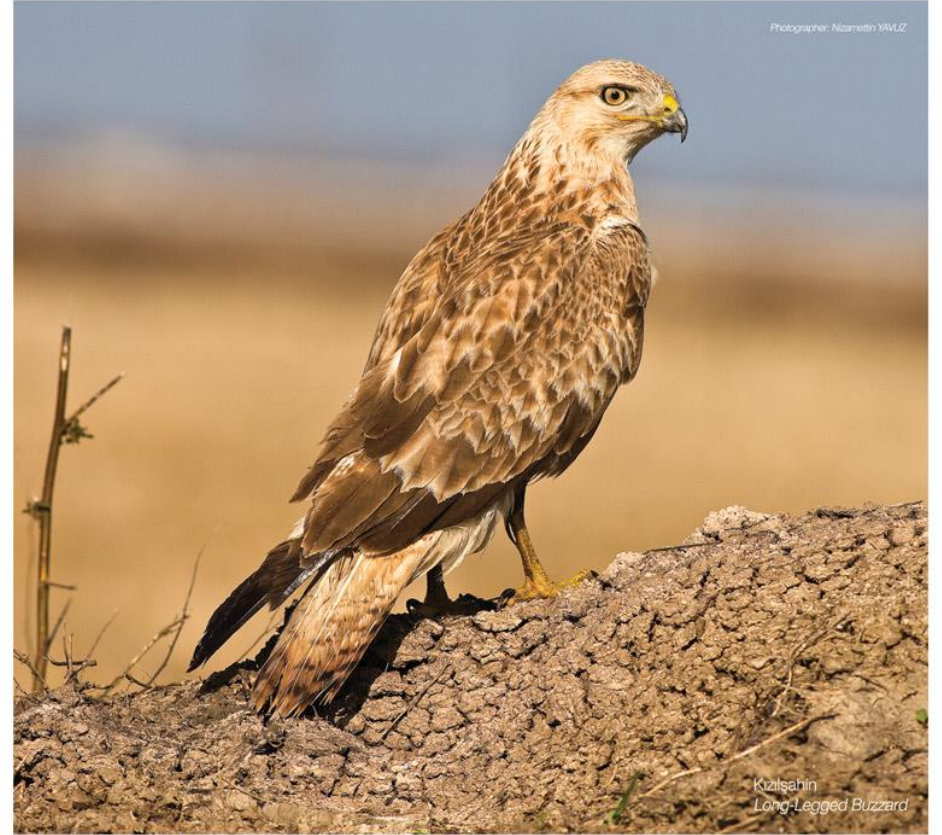
Kızılşahin Long-Legged Buzzard