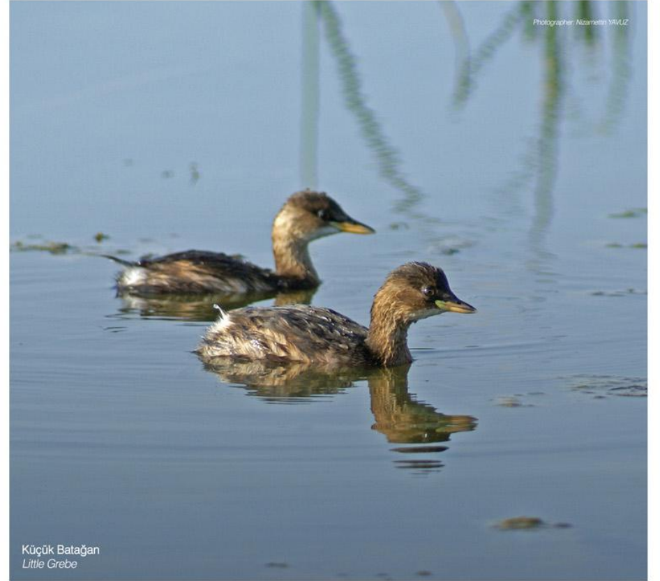
Küçük Batağan Little Grebe

The occupation of local people are agriculture and fishing and reed cutting is an other occupation for the minority of people.